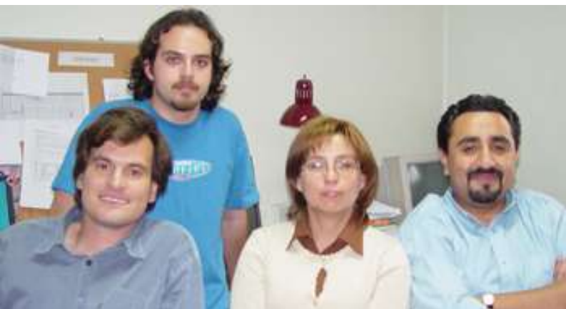
Equipo chileno del proyecto E-LANE.