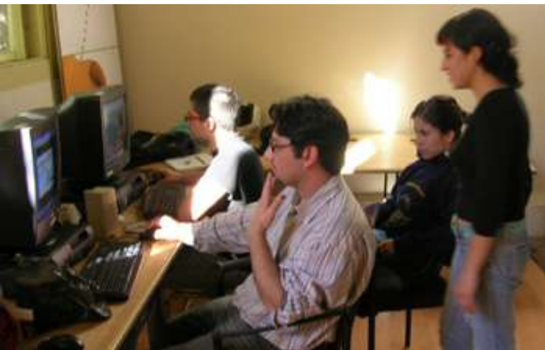
Alumnos UTEM, Design Studio.

Una vez que regresaron del viaje, comenzaron a trabajar en la materialización de los acuerdos que habían quedado plasmados en las visitas, particularmente con la Universidad de Western Sydney, en Australia. Así lo recuerda el docente: “Específicamente en el caso de