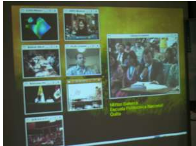
Puntos conectados en @LIS Day, a través de la tecnología ISABEL

El Programa @LIS busca promover la cooperación entre Europa y América Latina en temas sobre la sociedad de la información, y fortalecer los lazos existentes entre ambos continentes en áreas como telemedicina (e-Health), inclusión digital (e-Inclusion), educación (e-Learning) y gobierno electrónico (e-Government).