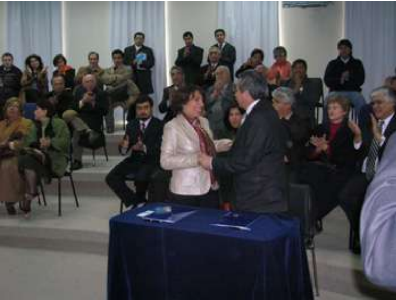
Celebración de la incorporación de la USACH a REUNA

Zúñiga destacó que “la inversión que se ha realizado en el CITECAMP es de aproximadamente 1.500 millones de pesos que permitirán a la comunidad universitaria tener más de 270 nuevos puestos de trabajo con computadores, un Auditorium Multiuso, Laboratorio de diseño de Nuevas Metodologías de Enseñanza a través de las TICs y dos Laboratorios de Idiomas”.