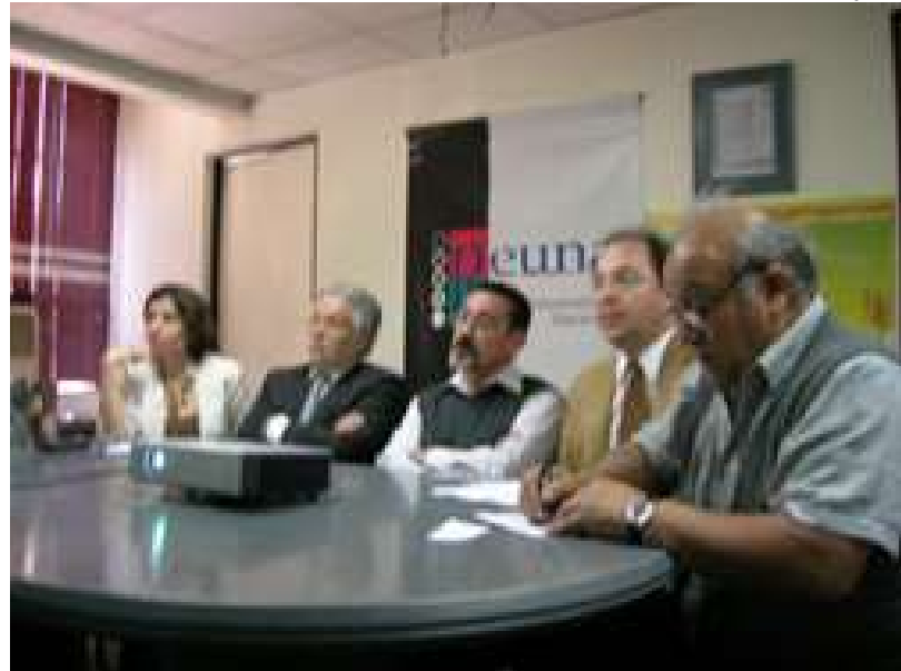
Participantes en Chile del @LIS Day.

Más información sobre el Proyecto E-LANE en: http://elane.dcc.uchile.cl