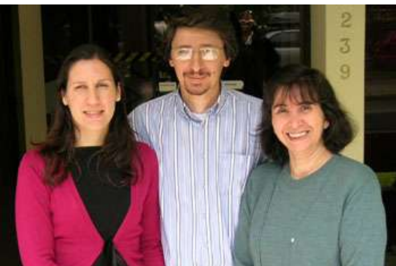
Gerencia de Proyectos, REUNA

¿Quiénes trabajan desde REUNA en este proyecto? En primera instancia, la Gerencia de Proyectos y Desarrollo deberá asumir la coordinación del trabajo que realizará Chile, sin embargo, por las características del trabajo, sin duda que necesitaremos de la experiencia de la Gerencia Técnica y los aspectos de difusión nacional serán apoyados por la Gerencia de Comunicaciones. En