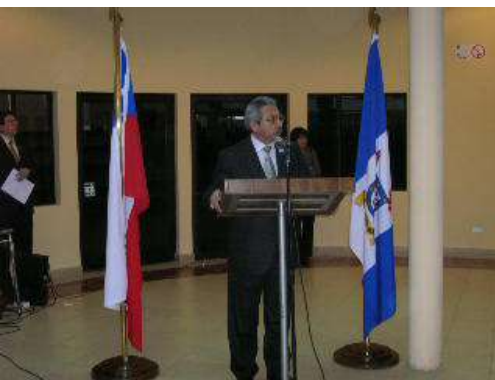
Ex Rector de la USACH, Ubaldo Zúñiga

Esta importante ceremonia se realizó en el marco de la inauguración de la Sala de Videoconferencias del Centro de Innovación en Tecnología Educativa y Centro de Aulas Multipropósito (CITECAMP), que provee a estudiantes y profesorado de 4.000 metros cuadrados de infraestructura tecnológica de primer nivel.