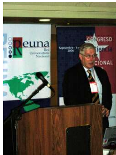
Tony Hey, panelista internacional